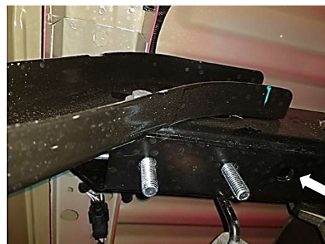
Introduzca la guía por aquí, por el extremo del espiral.