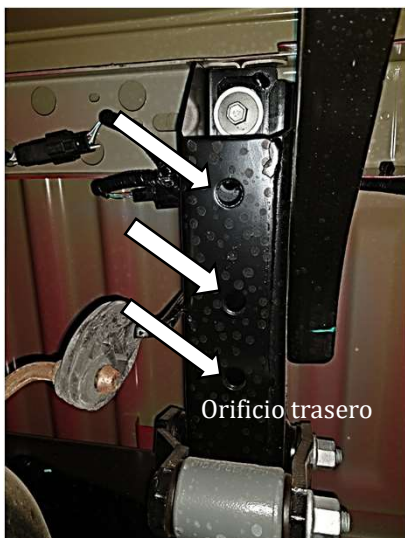
Guía para tornillo

2. Localice tres orificios parte inferior y uno parte lateral interna del chasis en lado pasajero, introduzca los tornillos con varilla. Para el orificio trasero, introduzca la guía para tornillo por el extremo del espiral. Para los demás orificios los puede introducir con la mano.